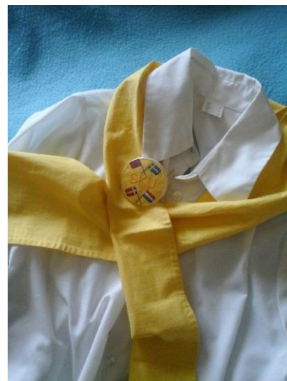
De vroegere koorleding: gele accenten

offerte leidde tot een opdracht, met extra afspraken onder andere over aanvulling bij uitbreiding van het aantal koorleden. Het Scandinavisch Koor staat nu bij elk concert of optreden in een prachtige outfit stralend te zingen over de natuur en alles wat erbij hoort om het leven tot een feest te maken.